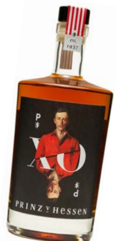
Prinz von Hessen XO Weinbrand

Aufgabe hinzu: Dies sind ein klassischer Chardonnay, eine Cuvée California und eine Cuvée Napa, die zusammen mit einem kalifornischen Spitzenerzeuger für Panamera kreiert werden. Können die Weine des Weinguts Prinz von Hessen noch veredelt werden? Da gibt es nur einen Weg: Über 25 Jahre hat der Prinz von Hessen XO Weinbrand im Holzfass verbracht. Nun ist er auf dem Markt. Experten beschreiben ihn als samtig und mild, mit expressivem, würzigem Bukett sowie komplexem Finish mit Nuancen von Eichenholz, Walnüssen und Karamel.