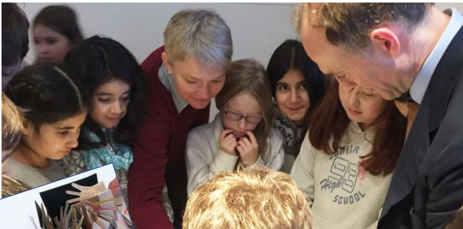
Landgraf Donatus mit den siegreichen Schülern und ihrer Lehrerin.