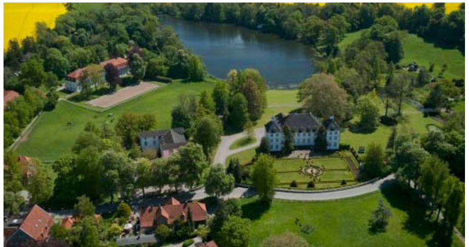
Der naturnahe Wald des RuheForst Gut Panker grenzt unmittelbar an das Gutsgelände. Impressionen der Begräbnisstätten finden sich unter www.ruheforst-panker.de .

derheit sind im RuheForst Gut Panker die Zeitzeugen der letzten Eiszeit, die Findlinge. Sie können ebenfalls als Begräbnisstätte genutzt werden. Eine namentliche Kennzeichnung ist zwar möglich, auf Grabpflege und -schmuck wird jedoch verzichtet, um das natürliche Waldbild zu erhalten. Die Trauerfeier findet im RuheForst unter freiem Himmel am Andachtsplatz statt, Bänke laden zum Verweilen und Erinnern ein. Es finden regelmäßig Gruppenführungen mit dem Förster an diesem schönen und stillen Ort statt.