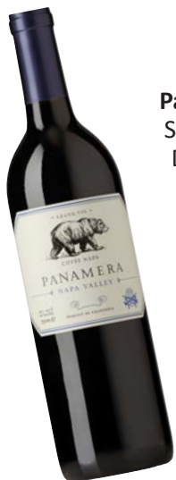
Panamera Cuvée Napa

Panamera heißt das neue Paradeferd im Stall der Weinhaus Prinz von Hessen GmbH. Dabei handelt es sich natürlich weder um ein echtes Pferd noch einen Wagen süddeutscher Provenienz mit mehreren hundert Pferdestärken, sondern um drei bärenstarke Weine aus Kalifornien. Sofort zu erkennen am kalifornischen Wappentier auf dem Etikett – dem Grizzlybären. Die Vertriebsfirma, die denselben Namen trägt wie das Weingut, war bislang für die Exportabwicklung der Weingutsweine zuständig. Nun kommt mit dem weltweiten Vertrieb von drei Kalifornischen Weinen eine neue