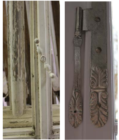
Links die sanierungsbedürftigen Rahmen mit Beschlag, rechts das perfekte Ergebnis nach der Bearbeitung.